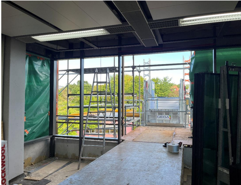
Einbringöffnung incl. Podest