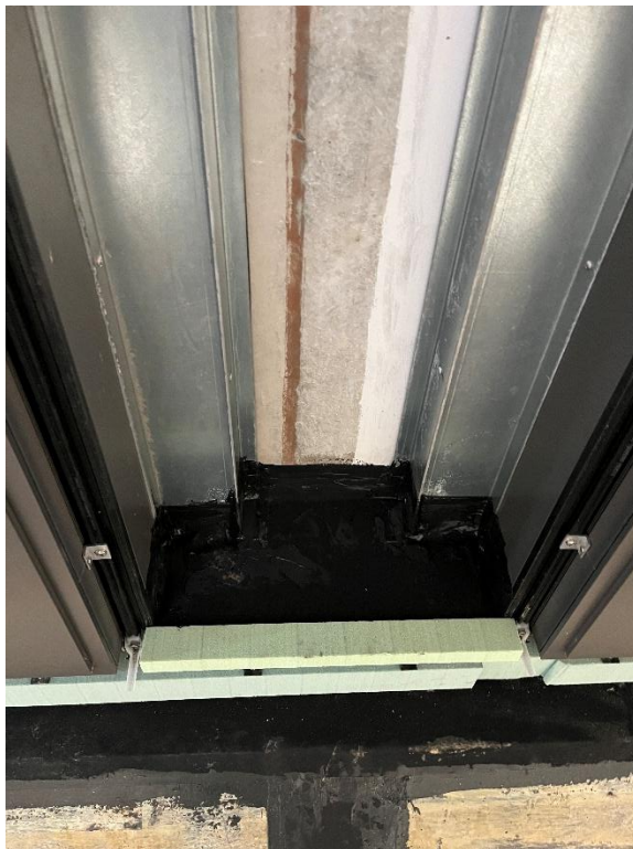
Stützenbekleidung Kalt-Warm Wechsel Wanne