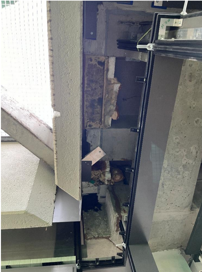
Oberer Anschluss Ecke E1_0