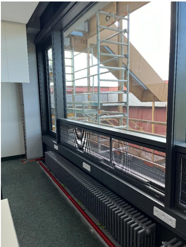
Ansicht innen mit Zugriffsschutz