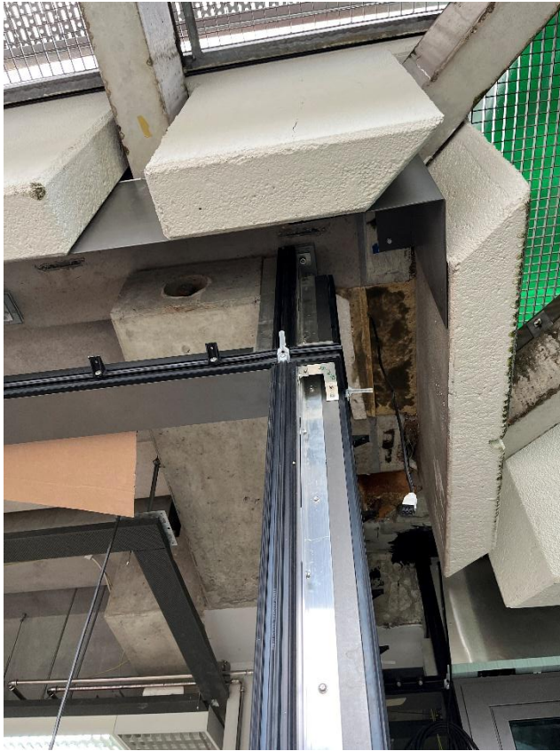
Oberer Anschluss Ecke E1_0