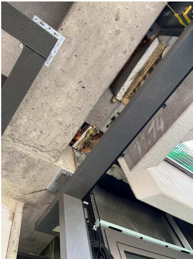
Oberer Anschluss Ecke E1_0