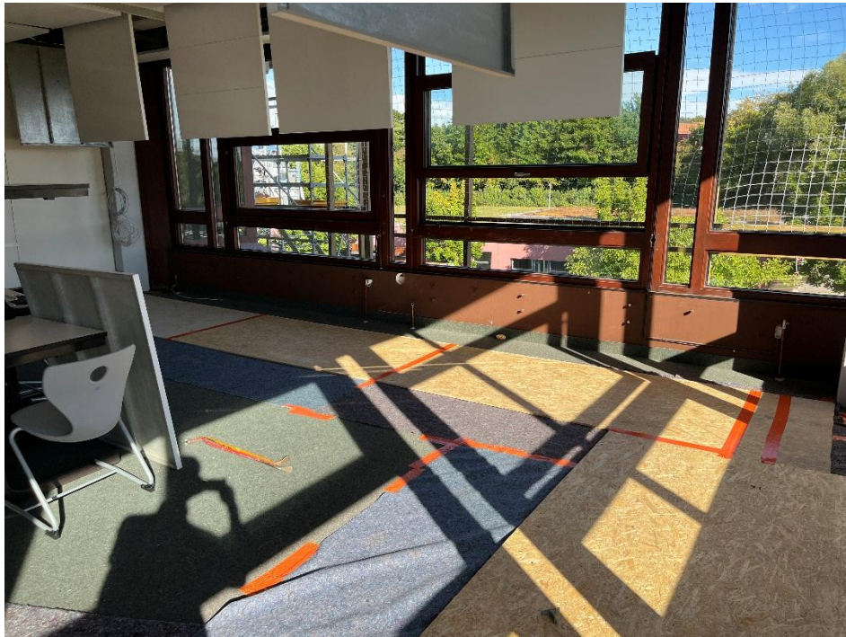
Schutzmaßnahmen Innen, Leistung ABBRUCH