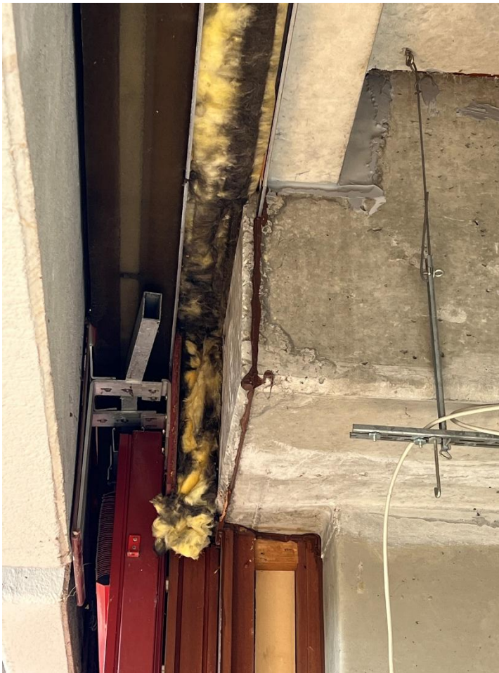
Bauanschluss oben mit STB- KONSOLE BESTAND