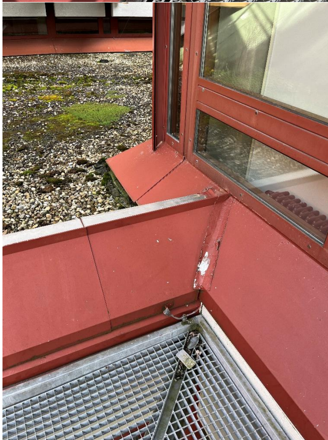
Eckverbindung 90° Dach + Fassade BESTAND