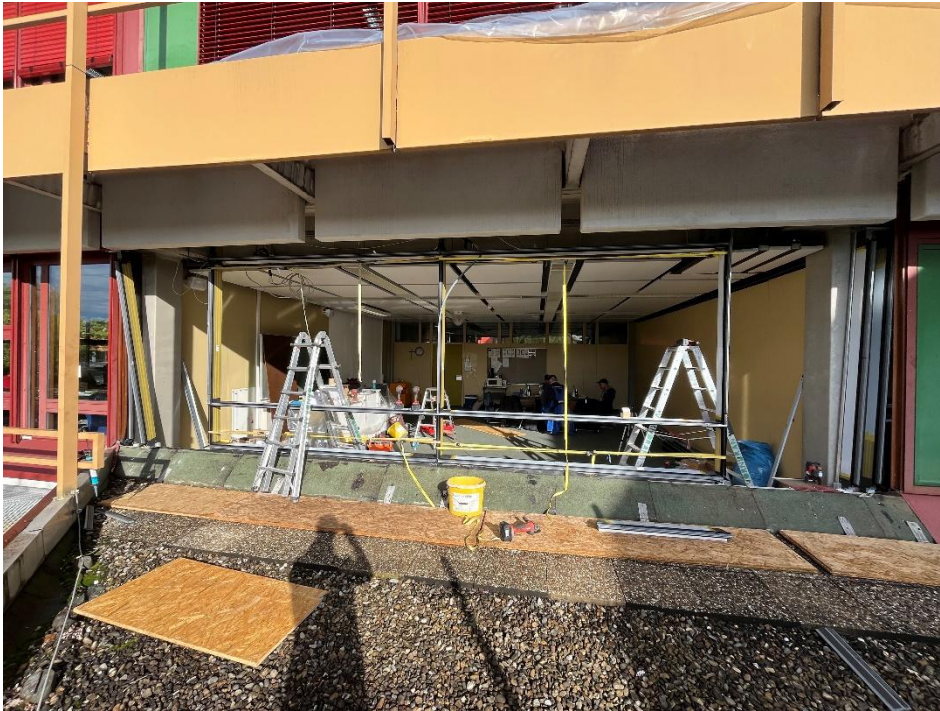
Außenansicht Mockup NEU