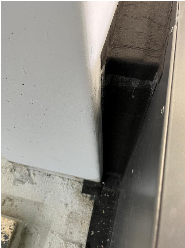
Anschluss innen Gebäudeecke E2_0