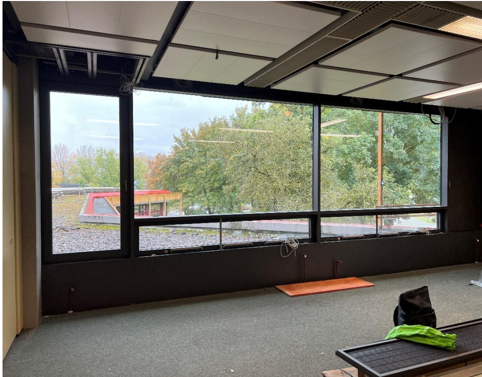
Ansicht innen ohne Zugriffsschutz MUSTERELEMEN T