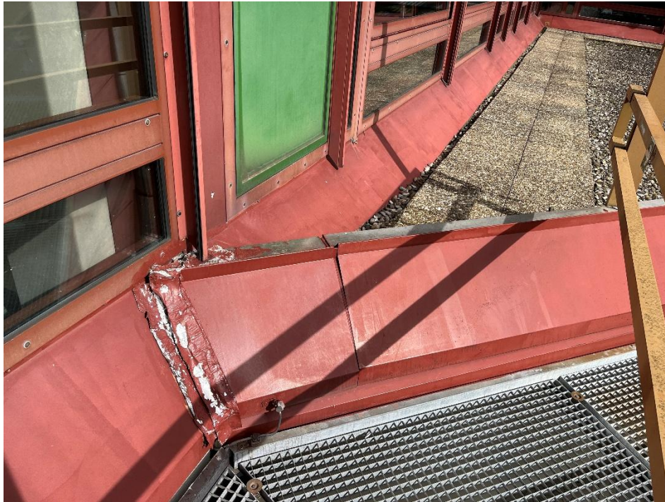
Eckverbindung 135° Dach + Fassade BESTAND