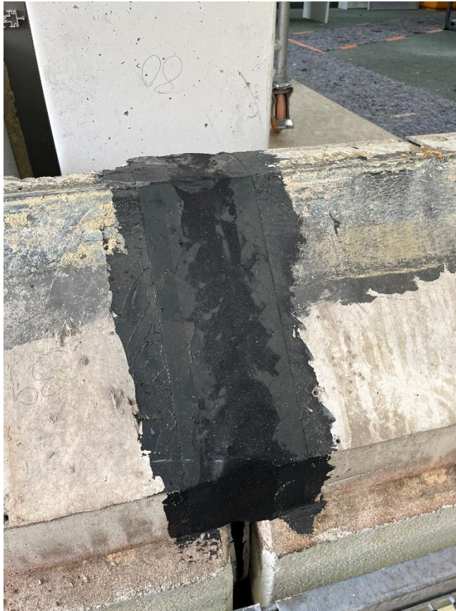
Abdichtung Stoßfuge Betonbrüstungen