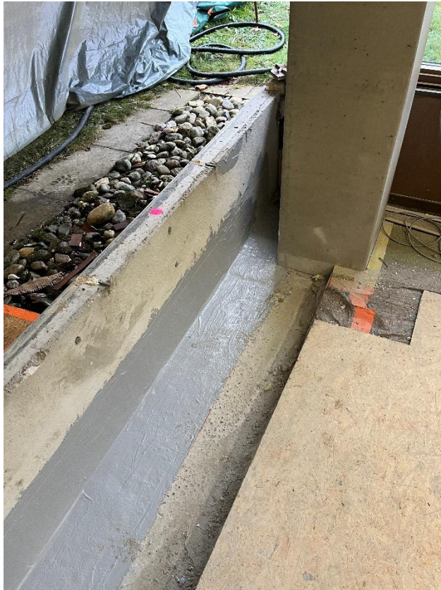
Bauwerksabdichtung Ebene 1