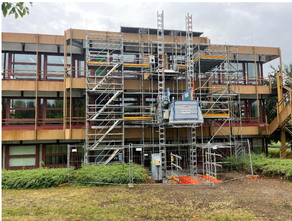
Gerüstturm mit Aufzug